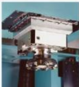
ATC+C裝置 (複合加工功能)