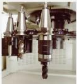
ATC裝置 (自動刀具交換系統)