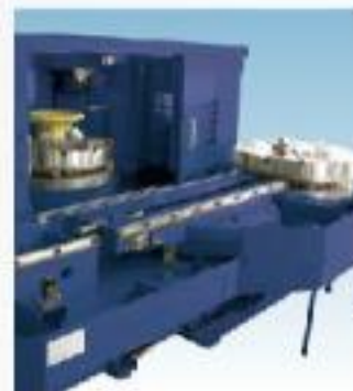
APC裝置 (自動工作盤交換系統)